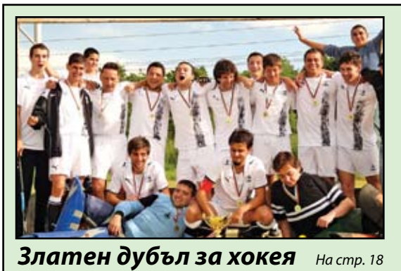
Златен дубъл за хокея На стр. 18

Към този начален момент на подготовката не