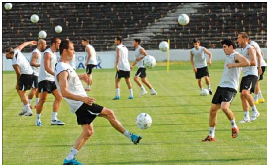
Първото занимание за сезона протече с много настроение