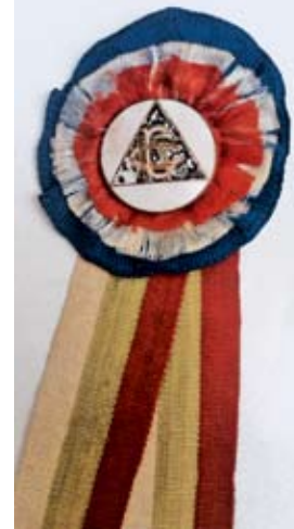
Значката на „Славия“ с двата триколюра

Редно е да се уточни и още нещо за конкретната значка. Преди Девети септември 1944 година българските значки са били на спортните дружества, а не на футболните клубове. В югославската изработка в черния триъгълник има някаква особена боя, която се рони и значката изглежда като мозайка. Дори с нарушен