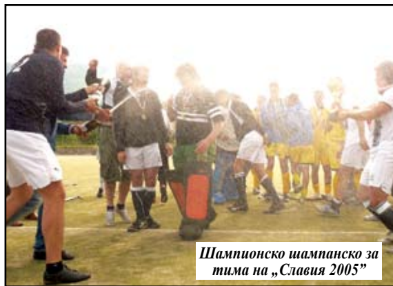
Шампионско шампанско за тима на „Славия 2005“

се играе всеки срещу всеки, като класиралите се на първите две места в елитната група играят