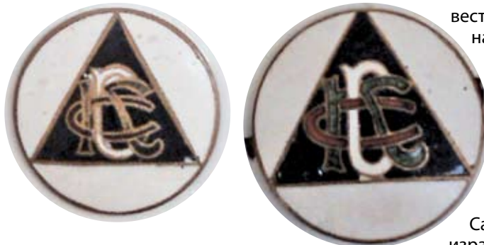
Австрийската плетеница (вляво) и значката от Чехия

дълговато. Известните значки от австрийската серия, притежавани от българи са само 3-4. „Чешката плетеница“ пък се намира в България. Цената е около 200 лева. Аббревиатурата „СКС“ означава „Спортен клуб „Славия“. Навремето е било модерно да се препликат буквите в хералдически гербове, каквато е и първата емблема на „белите“.