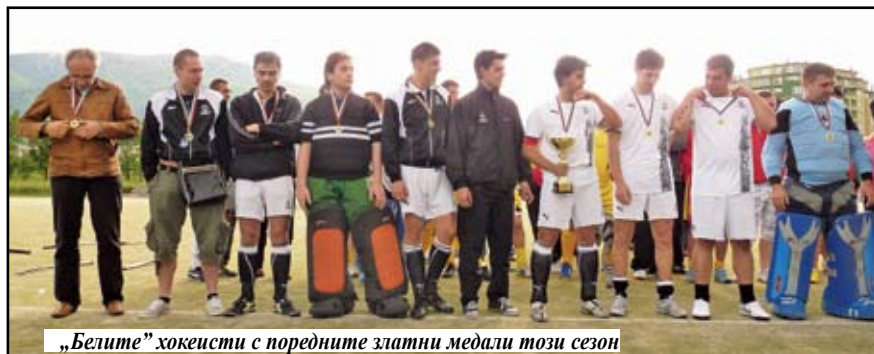
„Белите“ хокеисти с поредните златни медали този сезон